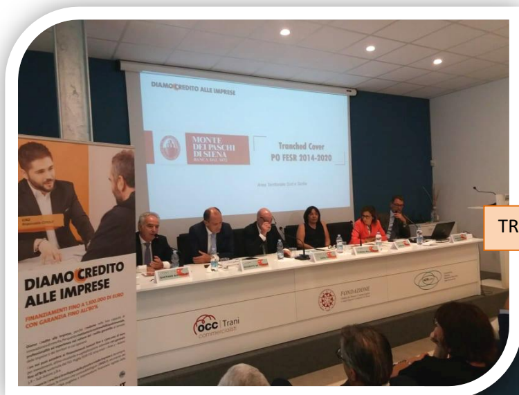
TRANI 2 ottobre – ODCEC