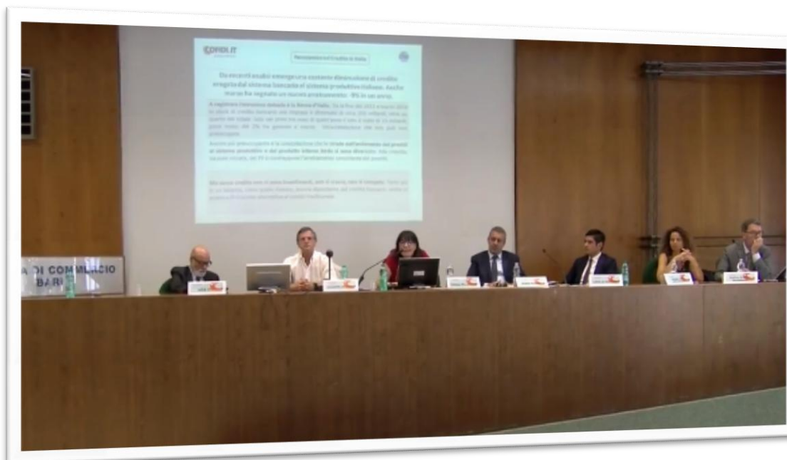
Gremita la sala convegni della CCIAA di Bari per il convegno organizzato da COFIDI.IT

La collaborazione tra Regione Puglia, COFIDI, CNA, Fondo Centrale di Garanzia e gli Istituti di Credito è la soluzione alla stretta creditizia che si sta imponendo sui mercati finanziari provocando sofferenza economica a numerose piccole e medie imprese. E' quanto è emerso nel corso dibattito "DIAMO CREDITO ALLE IMPRESE - La riforma del Fondo Centrale di Garanzia, le Misure Regionali e la nuova Tranchet Cover" che si è svolto presso la Camera di Commercio di Bari il 19 giugno scorso, organizzato da COFIDI.IT, società cooperativa di garanzia del sistema CNA pugliese e intermediario finanziario vigilato dalla Banca d'Italia.